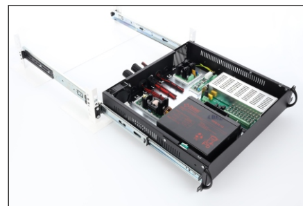
Montaż na szynie ARAS600N/800N/1000N